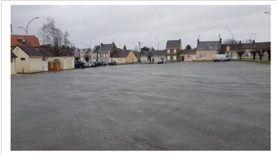
Jugée peu lisible et insuffisamment sécurisée, la place Charles-de-Gaulle est appelée à être réaménagée.

Quotidien Le Maine Libre, www.lemainelibre.fr , samedi 21 février 2026, 384 mots