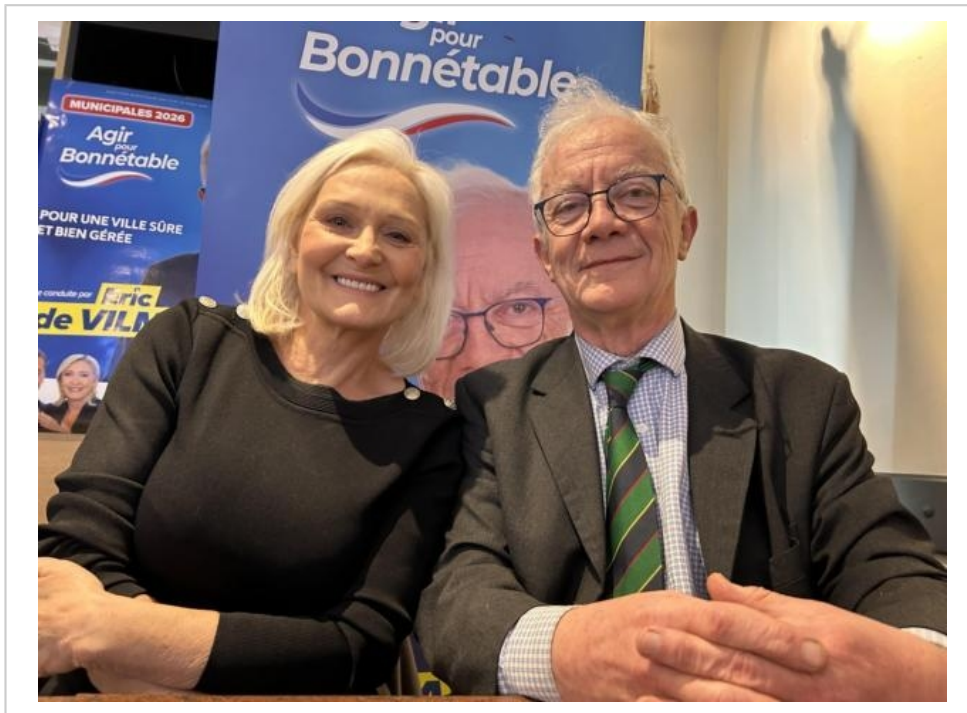
Bonnétable, vendredi 12 décembre 2025. Marie-Caroline Le Pen, tout sourire lors de la présentation de la candidature d'Éric de Vilmarest. Ce dernier n'a pas réussi à déposer une liste complète pour les municipales.

Quotidien Le Maine Libre, www.lemainelibre.fr , vendredi 27 février 2026, 608 mots