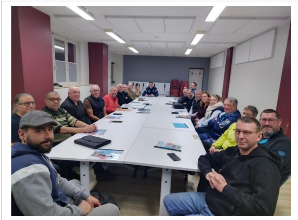
Les représentants des clubs de l'Omnisports de la Patriote de Bonnétable entourent les membres du bureau récemment réélu.

Quotidien Le Maine Libre, www.lemainelibre.fr , mercredi 25 février 2026, 405 mots